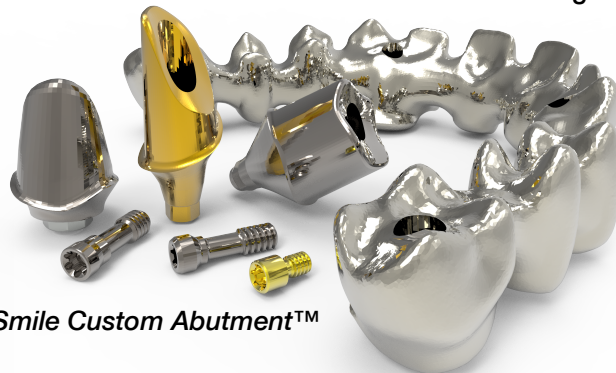
BioSmile Custom Abutment™